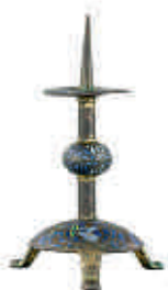
Chandelier - Limoges, vers 1180-1190 Cuivre repoussé, champlevé, émaillé et doré Paris, Musée de Cluny