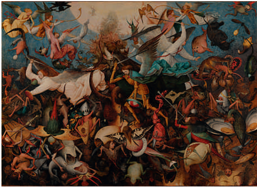
Bruegel : auprès des Anges Rebelles [Réalité Virtuelle] Exposition au Musée des Beaux-arts de Bruxelles - Bruegel