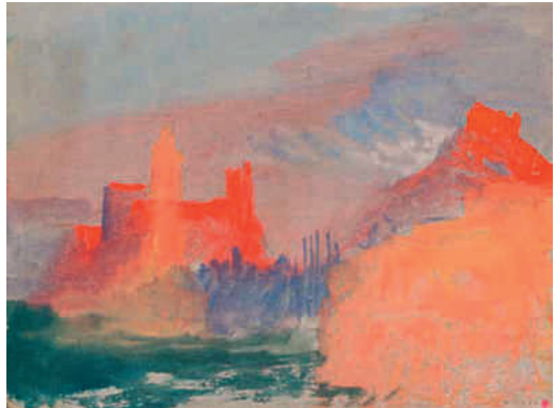
TURNER au Caumont Centre d'Art d'Aix-en-Provence - Du 04 mai 2016 au 18 septembre 2016 Les Tours vermillon : étude à Marseille

Vers 1838 Aquarelle et gouache sur papier gris Tate. Accepté par la nation dans le cadre du legs Turner en 1856