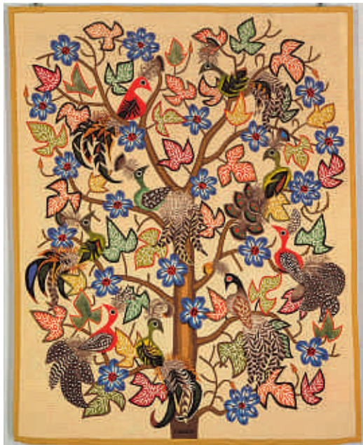
Abbaye-école de Sorèze - Musée de Sorèze

Considéré comme le précurseur de l'Impressionnisme, Joseph Mallord William Turner (1775-1857) règne sans conteste dans le paysage de la peinture anglaise du XIXème siècle.