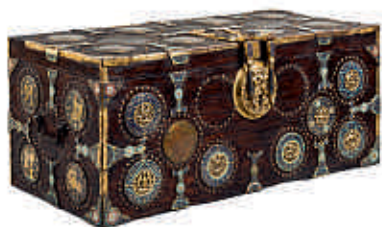
Coffre de Guala Bicchieri Limoges, vers 1220-1225 Cuivre ajouré, repoussé, émaillé et doré, bois de noyer Turin, Palazzo Madama - Museo Civico d'Arte Antica