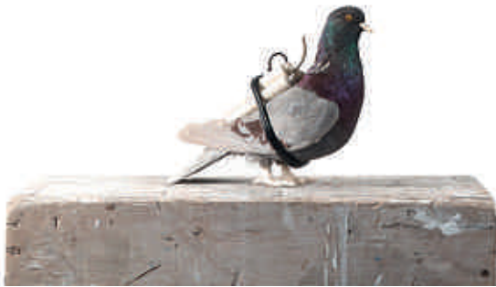
Adel ABDESSEMED, Jalousies

La Collection Lambert invite l'artiste Adel Abdessemed à investir le Musée de Vence, avec le soutien amical de Jean Nouvel.