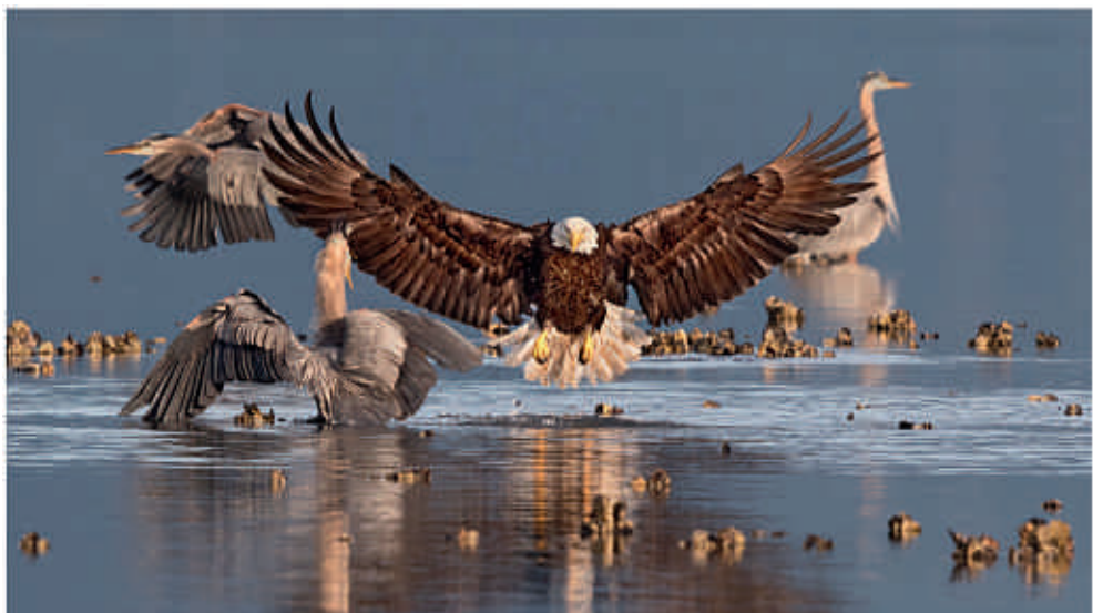
Bald Eagle and Great Blue Herons

Lauréat du Prix 2016 de la photographie