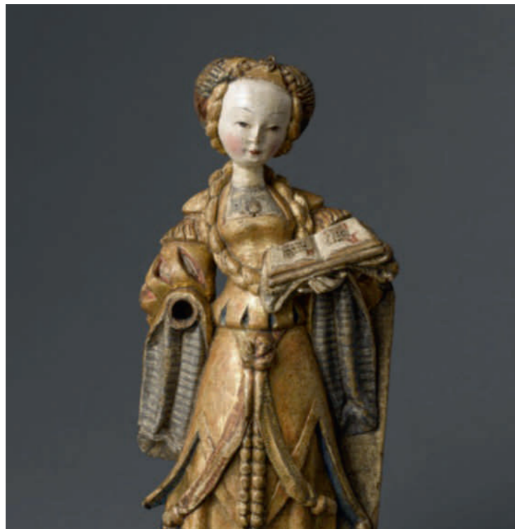
Sainte Barbe Malines, Belgique Vers 1515-1520 - Bois, polychromie