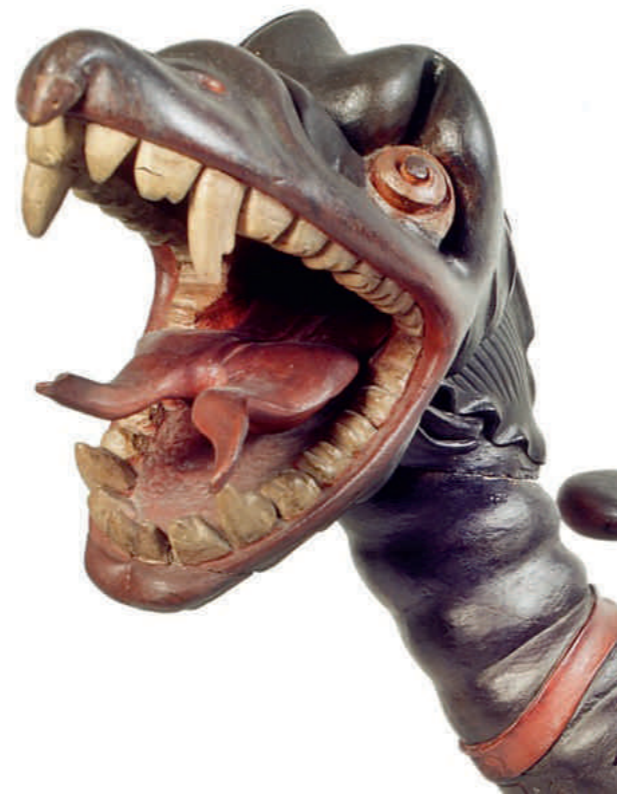
Musée Sainte-Croix à Poitiers Œuvre fétiche du musée

Selon les traditions médiévales ; un monstre sanguinaire, la Grand'Goule, horrible et sanguinaire sortie de son repère au creux de la rivière le Clain, pour s'aventurer dans les souterrains proches du couvent Sainte-Croix, fondé par Sainte Radegonde. Elle réussit à s'introduire jusque dans les caves du monastère et y dévora quelques malheureuses religieuses. Ni les suppliques, ni les prières de nones ne purent l'arrêter, et Sainte Radegonde courroucée, dut se résoudre à l'affronter et la poursuivit jusque dans son antre. La Grand'Goule, apeurée, chercha son salut dans la fuite et prit son vol, mais la Sainte l'abattit d'une malédiction et d'un signe de croix et le monstre mourut, tordu par d'affreuses souffrances.