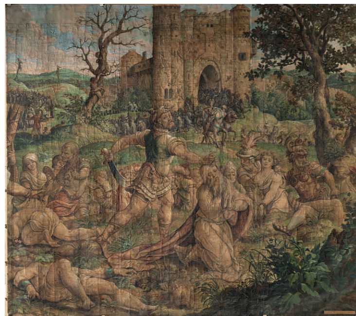
Le carton dans son ensemble, avant restauration : © KIK-IRPA

Consultez notre site web : www.veralbane.com